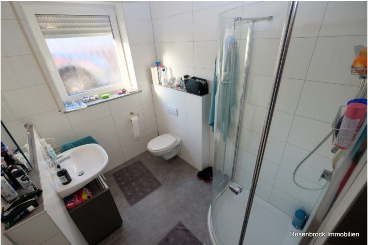
Im Tageslichtbadezimmer sind sehr gute Sanitäröbekte verbaut. Die Fliesen sind geschmackvoll in weiß und grau gehalten

im Bad. Das Badezimmer ist passend zum grauen Boden in Weiß gefliest. Und egal, ob Waschbecken, Dusche oder Toilette – alle Objekte sind von wirklich guter Qualität. Pfiffig: Im Eingangsbereich des Bades ist ein Platz für die Waschmaschine und den Trockner abgemauert.