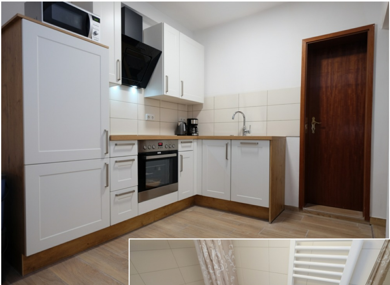
Die Einbauküche ist wie das ganze Apartment komplett ausgestattet, das Bad ist komplett renoviert

sene Wohneinheit. Ihr eigener Pkw-Stellplatz liegt direkt vor ihrer Tür, und vor dem Eingang ist noch ein Plätzchen für Tisch und Stuhl an der frischen Luft.